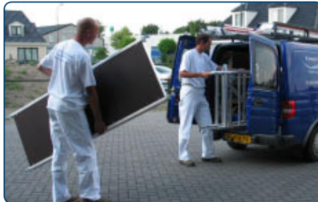
Compacte uitvoering vereenvoudigt het transport.